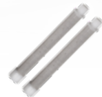
Filtros blancos de malla 60 (paquete de dos [2] unidades)