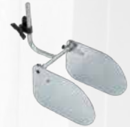
Protector de pulverización WindGuard