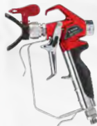
■ Pistola para dos dedos RX-Pro con boquilla 517