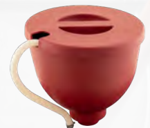
■ Tolva Elite 2000