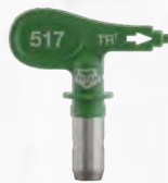
Boquilla HEA ■