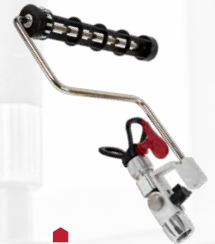
■ SprayRoller con boquilla 517