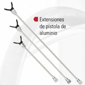
■ Extensiones de pistola de aluminio