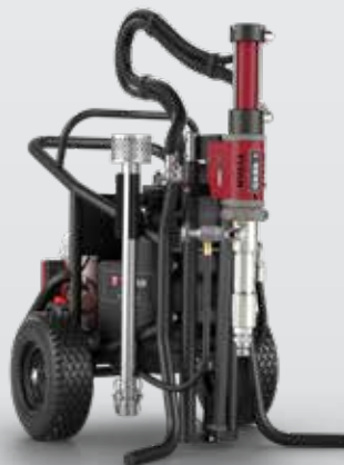
HYDRA X 4540

KIT DE CONVERSIÓN DE HYDRA X 7230 A 4540 2432905A