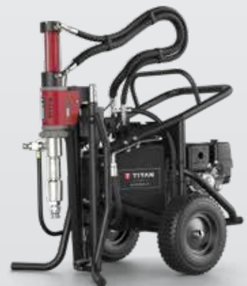
HYDRA X 7230